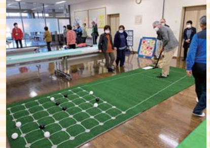
▲よりあい活動支援講座