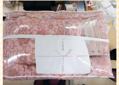
▲火災見舞品の支給