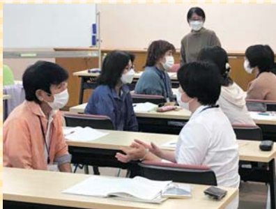
▲傾聴ボランティア講座