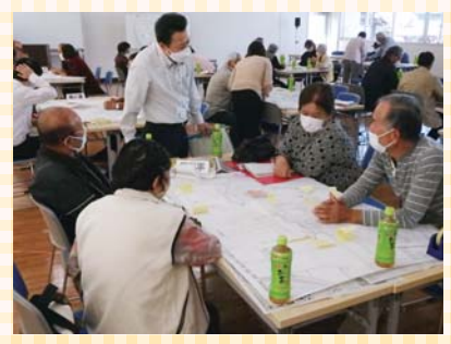
▲見守りマップづくり