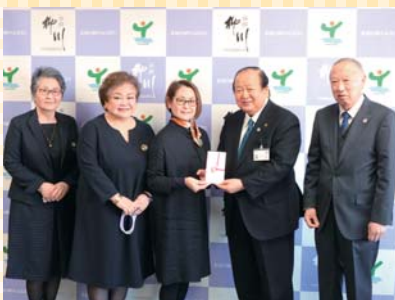
▲国際ソロプチミスト柳川様 による歳末たすけあい募金