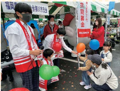
▲三橋中学校の生徒さんによる よかもんまつりイベント募金活動