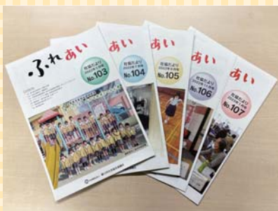
▲社協だより「ふれあい」の発行