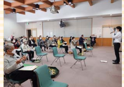
▲地区社協活動支援