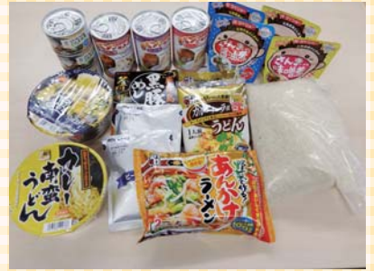
▲緊急支援品の支給