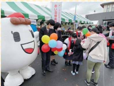
▲杉森高等学校の生徒さんによる よかもんまつりイベント募金活動