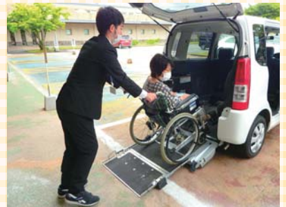
▲ハンディキャブの貸与